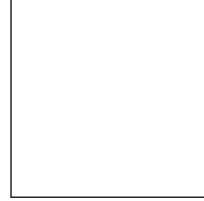
MAHMUT GÜRSES KARAYOLU DÜZENLEME GENEL MÜDÜRLÜĞÜ GENEL MÜDÜR