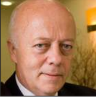
CAN BAYDAROL AB DANIŞMANI